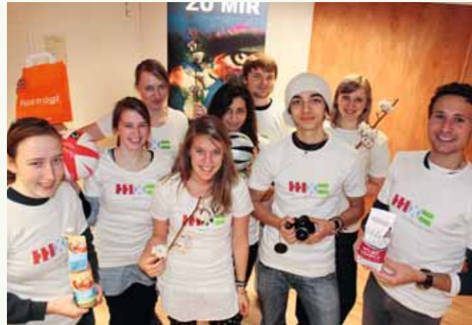
OBEN | Die Fair-Trade-Botschafter kennen sich gut aus und geben ihr Wissen an die Öffentlichkeit weiter.

Manche von ihnen waren als „Schoko-Agenten“ aktiv, einige designen Taschen- und T-Shirt-Aufdrucke, andere veranstalten Modenschauen oder Kochaktionen. All diesen Jugendlichen und jungen Erwachsenen gemeinsam ist das Interesse an Fairem Handel. Was das ist und wem er hilft, das vermittelt den zwölf- bis 25jährigen „hamburg mal fair - das Hamburger Aktionsbündnis für den Fairen Handel“, das mit zahlreichen lokalen Partnern wie der Verbraucherzentrale, Bildungseinrichtungen und Behörden kooperiert.