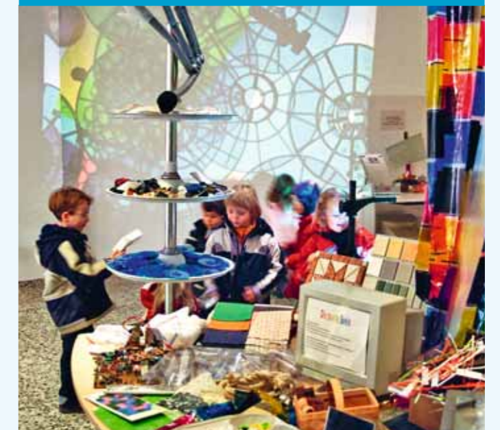
OBEN | Große Auswahl: Aus Folien oder Stanzstücken lässt sich so manches Kunstwerk herstellen.