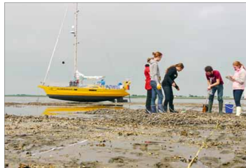
OBEN | Jugendliche setzen beim Meereswettbewerb ihre eigenen Ideen um.