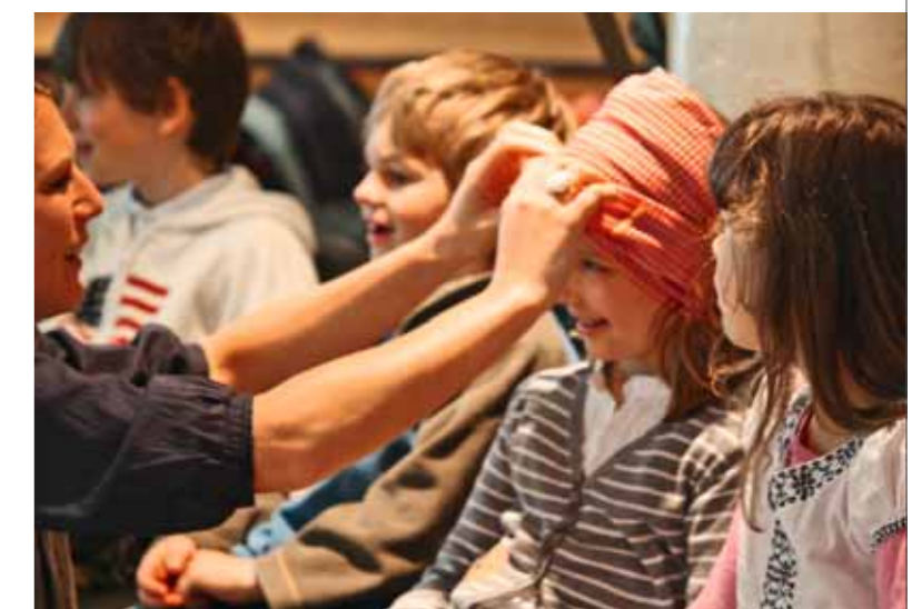
OBEN | Auch jüngere Schüler können schon etwas über globale Zusammenhänge lernen.