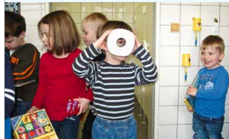
OBEN | Was ist alles aus Papier und wie stellt man es her? Kita-Kinder wollen es wissen.