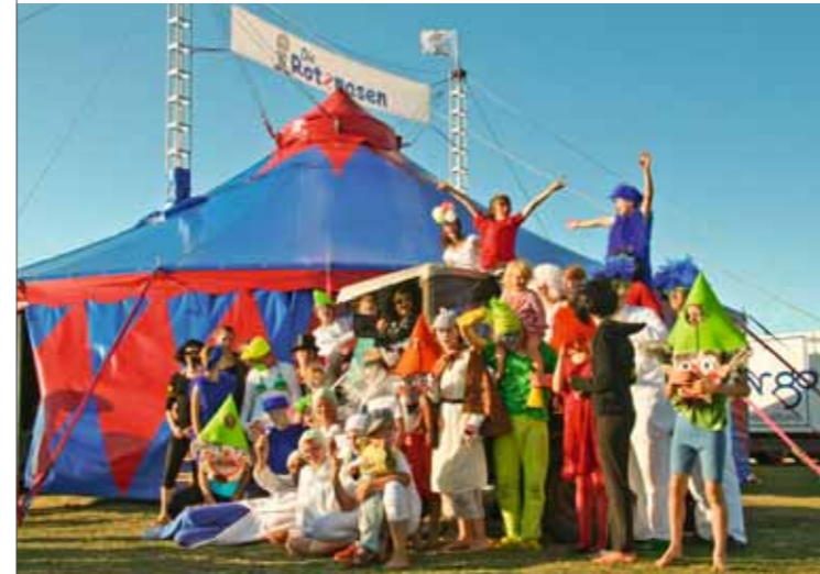
OBEN | Ein starkes Team: Die Mitglieder vom Schulzirkus „Die Rotznasen“.

Die Stadtteile St. Pauli und Altona sind dicht bebaut und haben kaum Grün- und Spielflächen. Sie bieten wenig Raum für Bewegung und die Persönlichkeitsentfaltung von Kindern und Jugendlichen. Soziale Vernachlässigung, das schwierige Nebeneinander verschiedener Kulturen