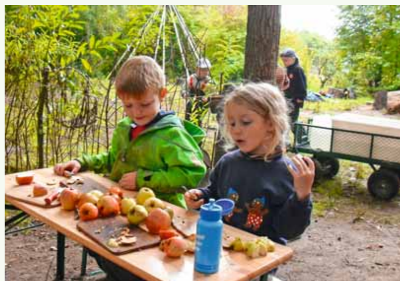
OBEN | Machen alles selbst: Kinder des Waldkindergartens Wentorf beim Äpfelschneiden.