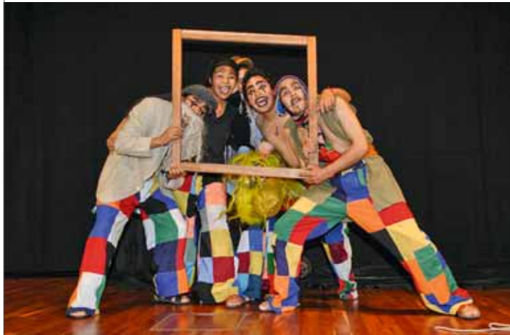
OBEN | Die bolivianischen Straßenkünstler vom Teatro Trono tourten 2011 durch Deutschland.