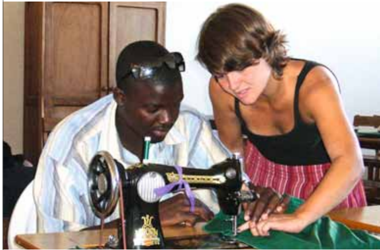
OBEN | Mosambikanische und deutsche Berufsschüler können viel voneinander lernen.