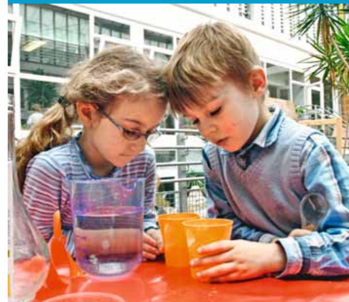
OBEN | Spannende Experimente lenken die kindliche Neugier auf Nachhaltigkeitsthemen.