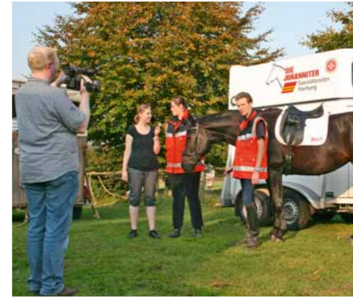
OBEN | Bei „wir-helfen.tv“ stellen Hilfs- und Rettungskräfte ihre Arbeit vor.